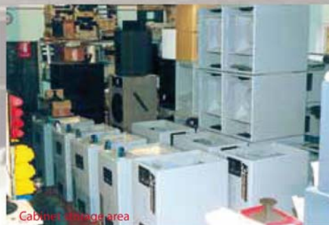
Cabinets storage area

Le specifiche possono subire variazioni anche senza preavviso The above specifications may be varied without fore-warning