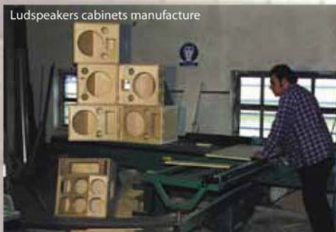
Loudspeakers cabinets manufacture