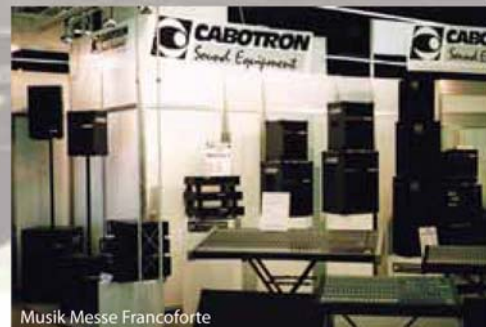
Musik Messe Francoforte