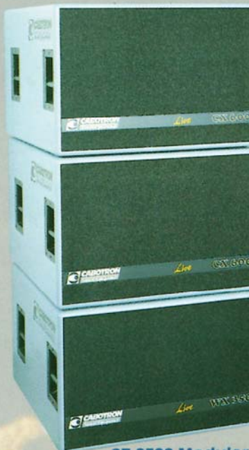
CX 600 N