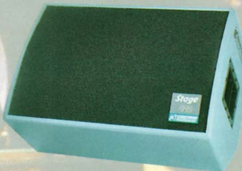
Stage 400 Active

Power/potenza: 220 Watt Woofer/coaxial system/altoparlante coassiale: 12" custom Dimensions/dimensioni: 45x44x35 cm Weight/peso: 18 kg