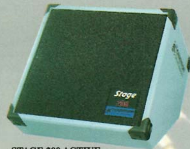
Stage 200 Active

STAGE 200 and STAGE 400 are self-amplified and are controlled by a "Cabotron" parameter processor.